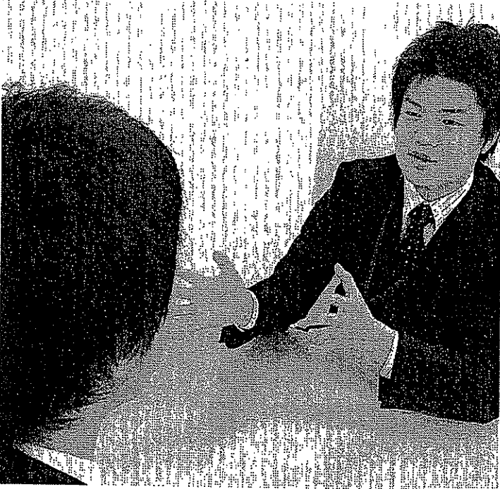
第二新卒の就職紹介に力を入れる学情(東京・千代田)には一般職を志望する男性も多く訪れる(左が求職者)